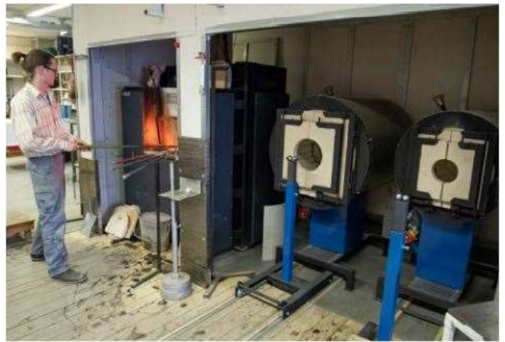
Verschiedene Öfen im Glasbläser-Atelier