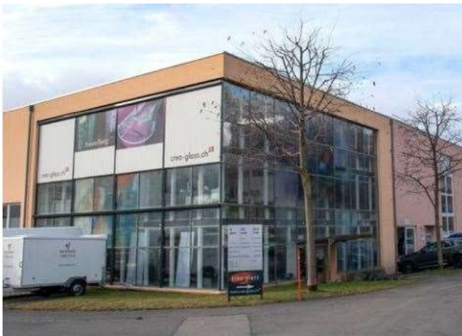
Firmenstandort direkt neben der Crea-Glass GmbH